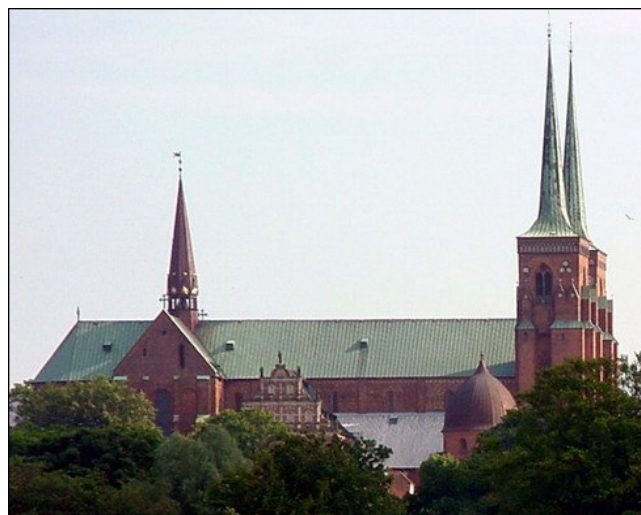
Roskilde domkirke Set fra Havnen