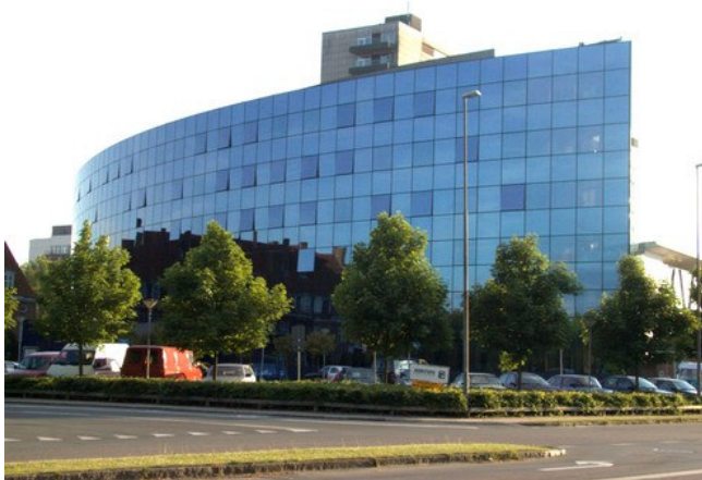
Odense Universitets Hospital